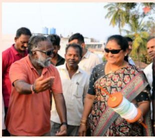
కమిటీ సభ్యులు పాల్గొన్నారు.